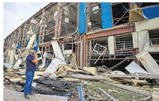
Имовина се продаје упркос ризику од бомбардовања: грађин Мерефа