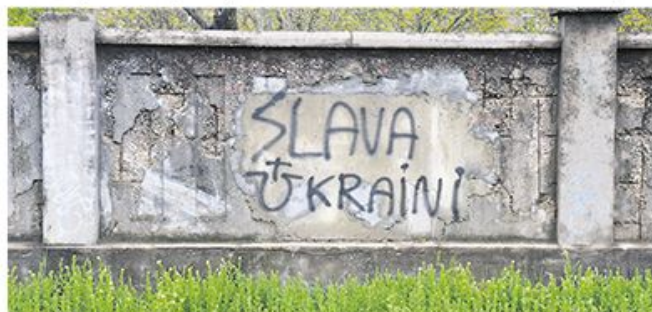
Украјина са уштаким словом „У“: графит у Загребу

Још се не зна прецизно колико је људи у Хрватској само у транзиту, а колико ће њих остати, али су званично саопштили да је у овом тренутку држава спремна да прихвати око 20.000 особа. страница 4