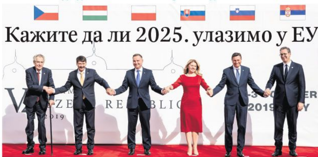
Милош Земан, Јанош Адер, Анджеј Дуда, Зузана Чапутова, Борут Пахор и Александар Вучић јуче у Прагу