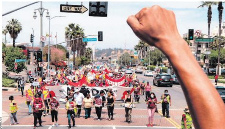
Првомајски протест у Лос Анђелесу на којем је тражена реформа имиграционе политике САД

Левица прелази у домен заштите мањинских права, екологије и ЛГБТ популације, а све мање се залаже за правичну расподелу богатства