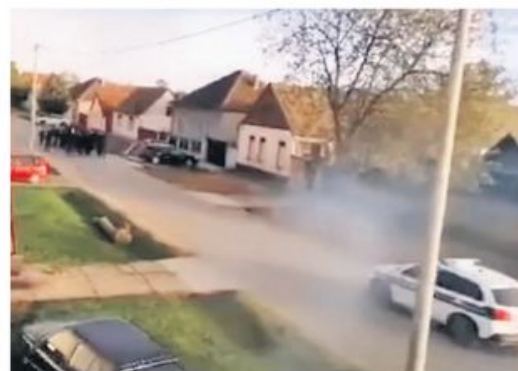
Борово: инцидент на православи Ускрс

Хрватска полиција привела је јуче 14 особа због инцидента на православи Ускрс у Борову, месту са већинским српским становништвом, када је група од двадесетак млађих мушкараца, под полицијском пратњом, урлала „Убиј Србина“ и „Ој, Хрватска, мати, Србе ћемо клати“. Против њих је покренута истрага због сумње да су починили кривично дело јавно подстицање на насиље и мржњу, пренео је „Индекс.хр“. Портал истовремено наводи да хрватска полиција у недељу није споминила кривично дело подстицање на мржњу, већ је процењивала да је реч о „прекршају“. Иначе, хрватска полиција у недељу у Борову није одмах реаговала поводом овог инцидента.