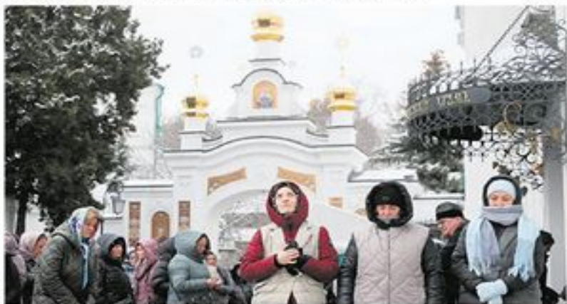
Верници у молитви пред манастиром у којем су поздрављени мошти 140 светиња