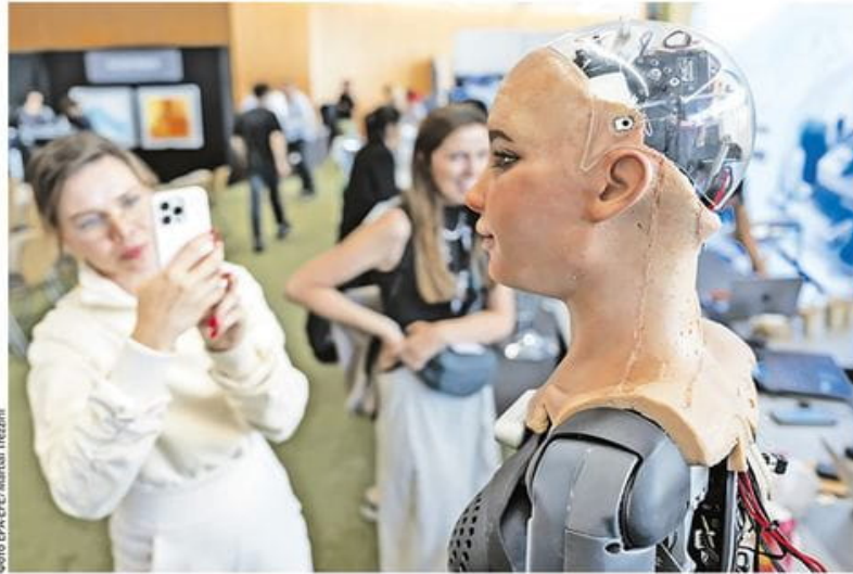
Сене ЕРА ЕЕЕ/Martina Treznik

Људска врста која тежи самоуништењу створила је суперинтелигентне машине које теже да опстану