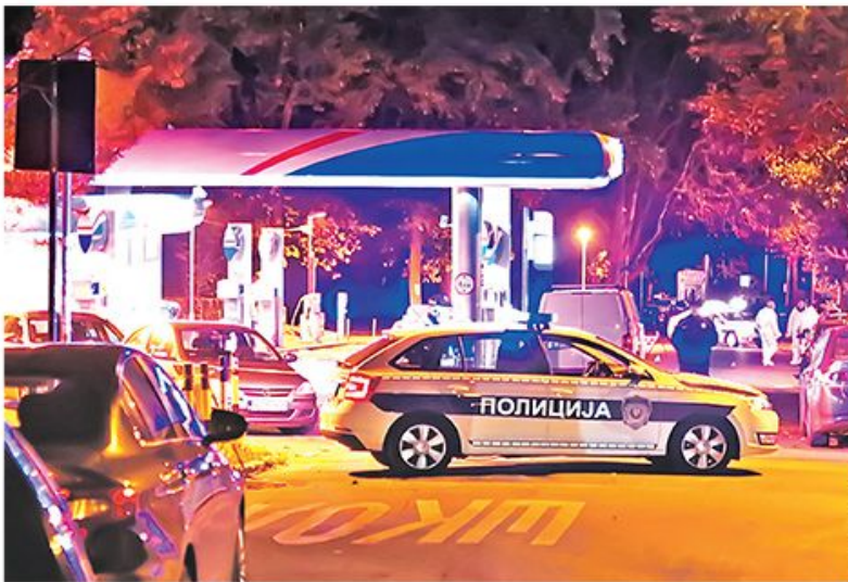
Увиђај на месту убиства Љубомира Марковића Киће, за које се сумњичи група Вељка Беливука