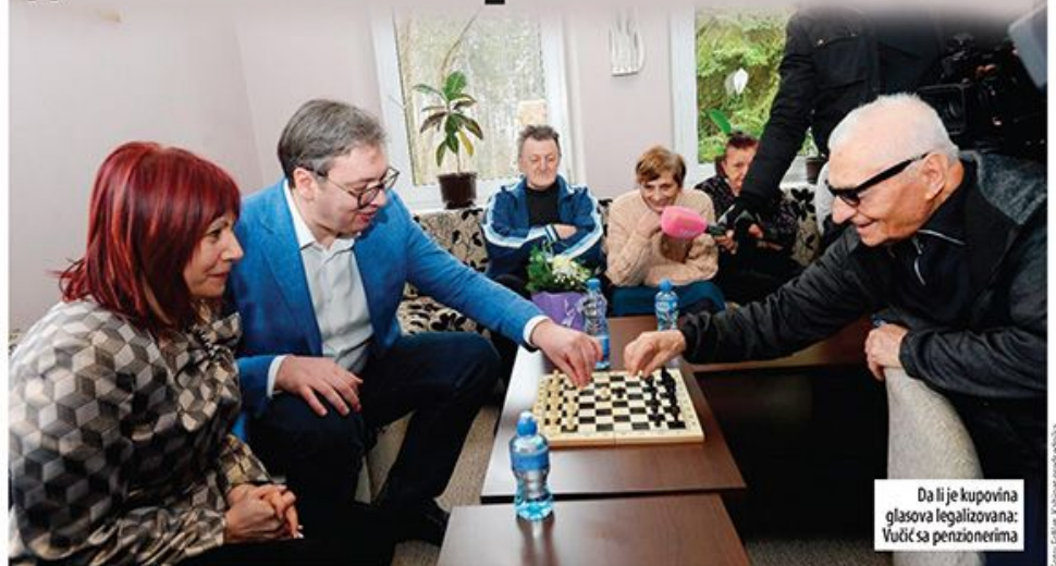
Da li je kupovina glasova legalizovana: Vučić sa penzionerima