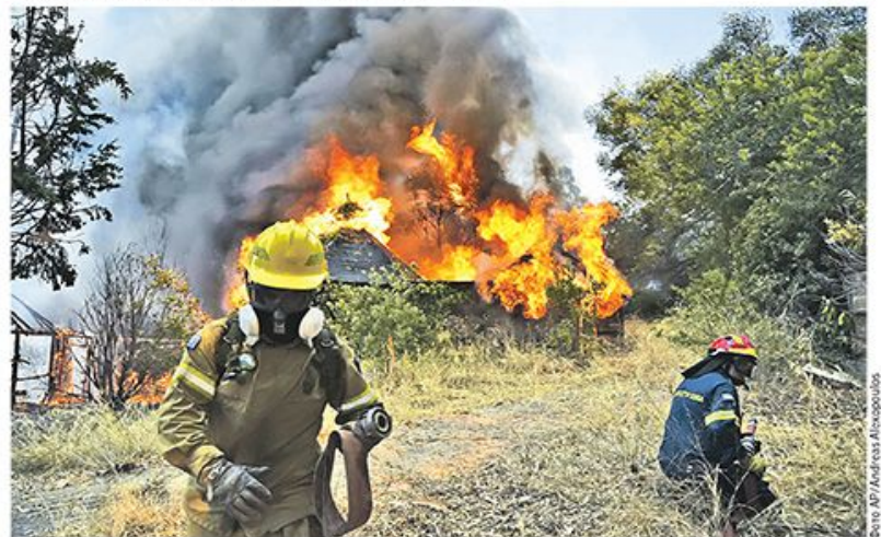
У пламену нестају куће, има повређених, шуме и хектари зелених површина претварају се у згаристи

У седам од десет области тражи се увођење ванредне ситуације, јер је за стављање пожара под контролу неопходна специјална координација и мобилизација ватрогасних бригада и добровољаца како би се спречило да на северозападу и северу острва ватра захвати туристичке објекте. страница 2