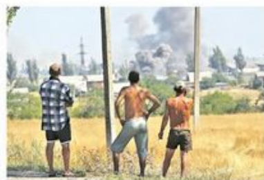
Проруске снаге заузеле су Новоазовск и напредују ка Маријупољу

„Довео сам одлуку да откажем ратну помоћ Турској због значајног погоршања ситуације у региону Дњепска, а посебно у градовима Амброузијка и Старобешево, амајдују у виду да су руске снаге ушле на подручје Украјине“.