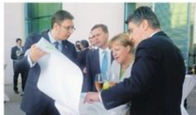
Александар Вучић и Јоран Милановић са Ангелом Меркел