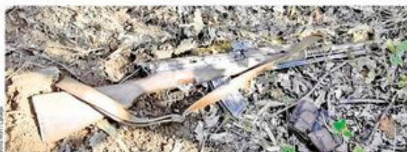
Пушка која је остала после бега албанских шумокрадаца