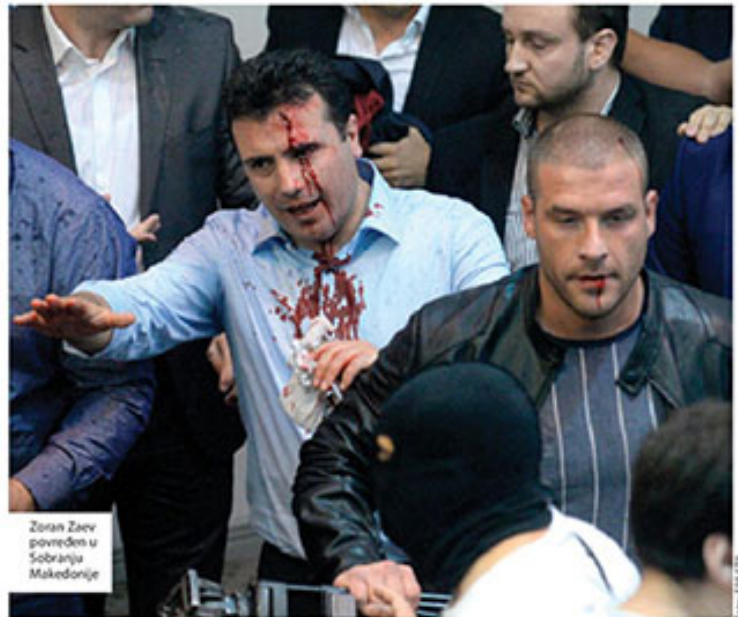
Zoran Zaev povređen u Saboranju Makedonije