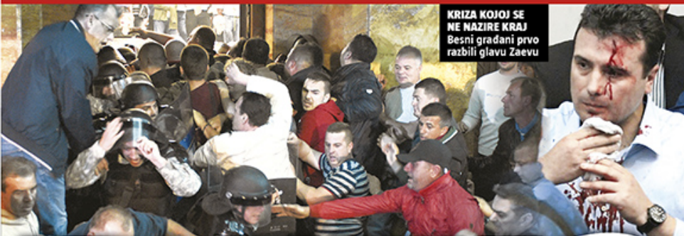
KRIZA KOJOJ SE NE NAZIRE KRAJ Besni građani prvo razbili glavu Zaevu