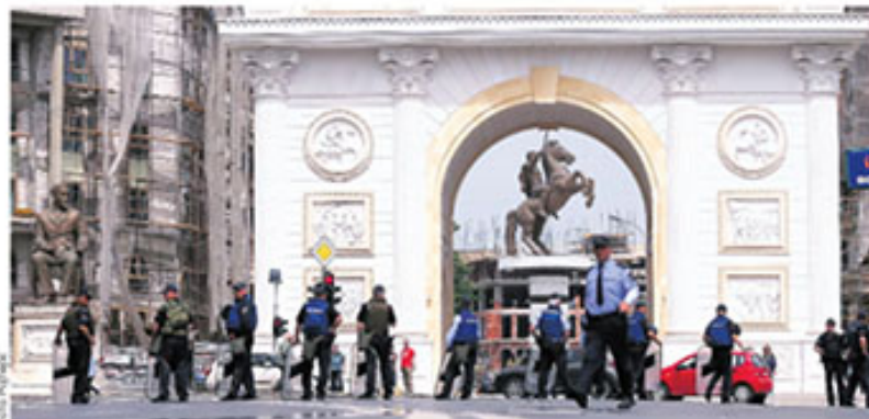
Напетост у Скопљу и јуче је била приметна

Зоран Заев најавио да ће после избора Талата Цаферџија за председника Собрања политички процес бити настављен избором нове македонске владе