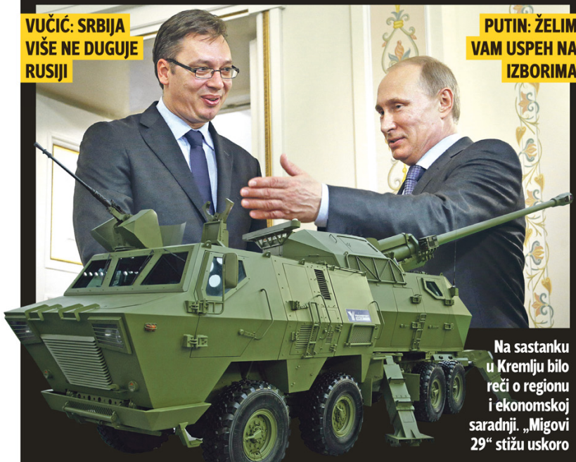
Na sastanku u Kremlju bilo reči o regionu i ekonomskoj saradnji. „Migovi 29“ stižu uskoro