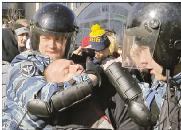
Srpski premijer je doveo u vezu proteste u prestonicama Rusije i Srbije: Demonstracije opozicije u Moskvi