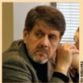
Независно удручење новинара Србије изабрало ново руковођство

Arežina: Postojanje novinarstva dovedeno u pitanje