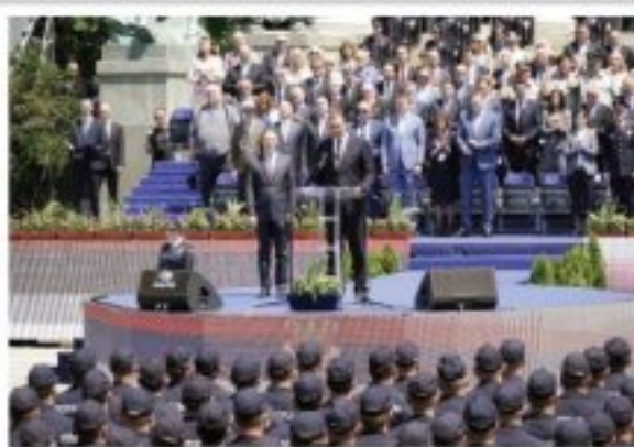
Uz svečani defile svih jedinica policije i demonstraciju vežbe proslavljen Dan MUP-a ispred Narodne skupštine