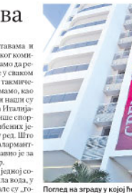
Поглед на зграду у којој ће бити смештени олимпијски мисија Србије