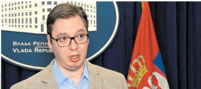
Премијер Србије саопштава одлуку