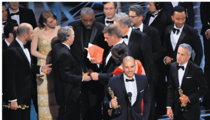
Општа забавна: екипа филма „Ла ла лена”, са Оскарима у рукама, сазнаје да није добитник

Једна од мера безбедности података о добитницима награда Америчке филмске академије јесте да су две особе у обавези да запамте имена свих добитника по категоријама