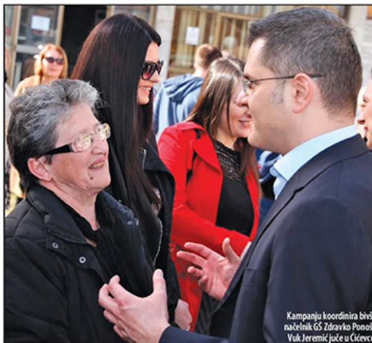
Kampanju koordinira bivši načelnik GS Zdravko Ponoš. Vuk Jeremić juče u Čičevcu

Aleksandar Vučić i Srpska napredna stranka u izbornu trku za predsednika Srbije kreću 2. marta sa juga Srbije, iz Vranja. Naprednjaci i socijalisti već su utvrdili plan kampanje za predsedničke izbore, a formirani su i zajednički izborni štabovi po opštinama i okruzima.