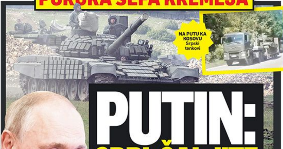
NA PUTU KA KOSOVU Srpski tenkovi