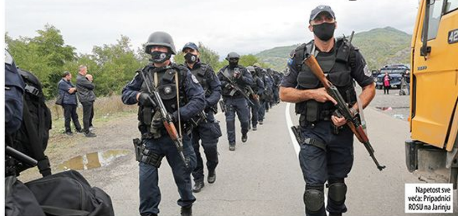
Napetost sve veća: Pripadnici ROSU na Jarinju