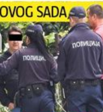
RAZGOVOR S KOMŠIJAMA Policija pretražuje Novi Sad