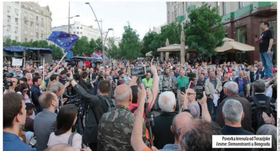
Povorka krenula od Terazjske česme: Demonstranti u Beogradu