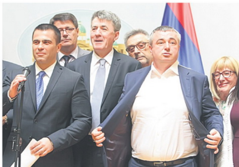
Рат изјавама: посланици СПС-а јуче у парламенту

Део опозиције бојкотовао седницу, оптужујући Мају Гојковић да спречава њихове предлоге, док она одговара да су фалсификовали допуне дневног реда, уз притиске на запослене у писарници