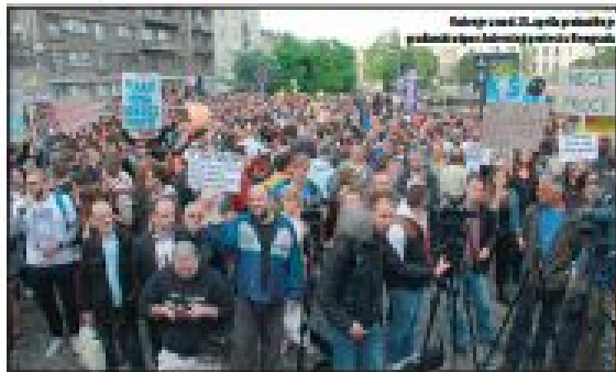
Protesti u Beogradu zbog preporuka o Savamali