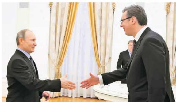
Владимир Путин и Александар Вучић