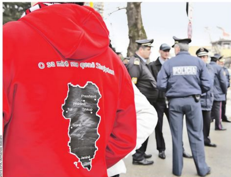
Мапа велике Албаније на јакни навијача пред фудбалску утакмицу у Тирани