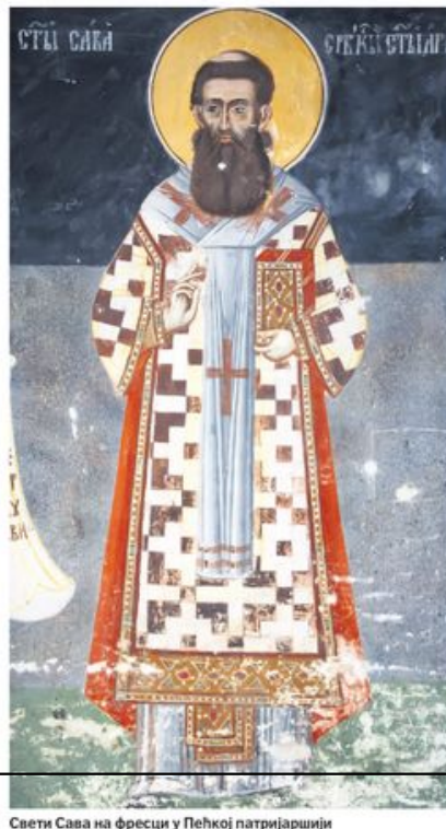
Свети Сава на фресци у Пећкој патријаршији

Иако су заступници Југобанке нагласили пред судом у Сплиту да ова банка већ три деценије није могла да управља својом имовином у Хрватској, која не поштује Споразум о питањима сукцесије, као и упркос чињеници да се главни стечај води пред судом у Београду, хрватско правосудје је доследно спровело отимање имовине правних лица са седиштем у Србији. страница 13