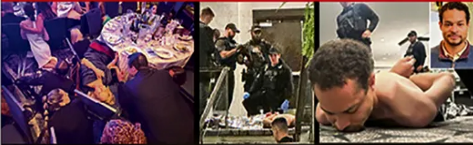
DRAMA U 'HILTONU' Atentator izrazio poštovanje na tradicionalnoj večeri koju organizuje Bele kuće