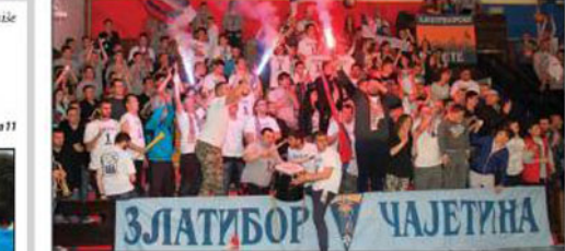
KK „Zlatibor“ posle 38 godina postojanja napravio istorijski uspeh plasmanom u Košarkasku ligu Srbije