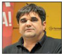
Lokalne izbore u pet gradova pratile nepravilnosti, tvrdi opozicija