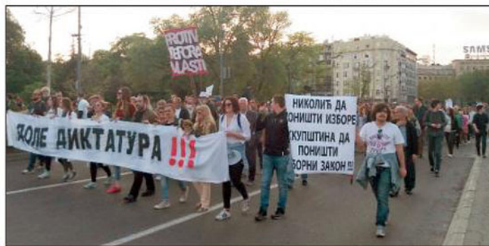
Beograd sinoć. A gde su studenti?