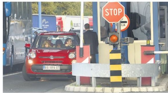
Нормализован саобраћај преко Батроваца – „фића” са српским таблицама међу возилима која су ушла у Хрватску

Ивица Дачић прогласио велику победу Србије. – Зоран Милановић попустио под притиском ЕУ. – Распуштен хрватски Сабор