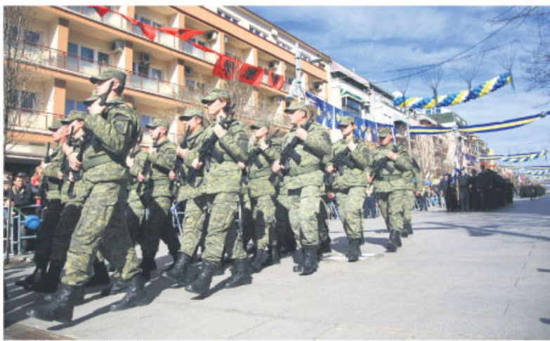
Приштина: армија Косова у настајању

Секретар Савета безбедности Руске Федерације, шеф свих руских специјалних служби Николај Патрушев борави данас у Београду, где ће имати сусрет са председником То-