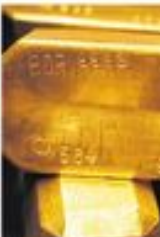
Код кога су највеће резерве злата

Са око 17,4 тона власништва метала спадамо међу богатије у региону, али то блага чини света 4,35 одсто златних резерви