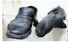
Личне ствари патријарха Павла изложене у Музеју СПЦ

Личне ствари патријарха Павла изложене у Музеју СПЦ. Изложба личних ствари патријарха Павла изложене у Музеју СПЦ.