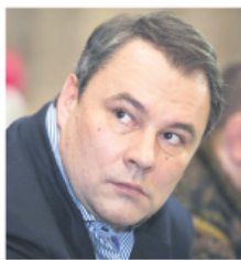
Званично је глава чувене грофовске породице Толстој