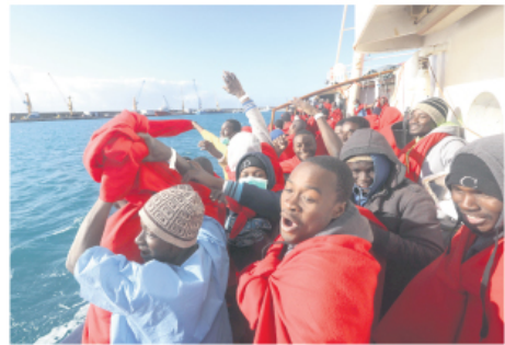
Више од милион избеглица с Блиског истока и из Африке се 2015. године домогло „фамилије“, махом преко Балкана

Дахла (Мароко) – Више од 180.000 Италијана напустило је лане доминичку да своју будућност траже негде другде. У економску миграцију, трбухом за крухом, ти Италијани отишли су легално, с пасошима. Када исти такав покрет – из оскулице и економског безања, ка замислионом бољем животу – учине хиљаде Африканаца, на Медитерану и широм Европе диже се узбуна. Туђи ратни боловама распоређују се ка јужним обалама Средоземља, стручајци за затварање граница нуде се у Сахари, док се Европљани код куће опасују зидовима као у средњем веку. Зашто Европљани могу тако лако задику снагу и траже нове животне адресе, а Африканцима се иста могућност ускраћује на свакојак, па и бруталне начине? Како је таква дискриминација могућа у 21. веку – питао се прошле суботе учесник међународне дебате у Дахли, на југу Марока, током трећег Кран Монтана форума о Африци.