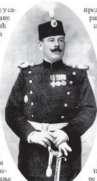
Другутина Димитријевић Апис

Плотуни су одје- кнули у праксоворје тог дана, а лекар вој- ног суда установио је смрт тројице осуђе- них десетак минута касније, у четири часа и 47 минута по локал- ном времену. Догађаји који су се одиграли не- посредно пред стрељање и детаљи извршења смр- не казне добро су познати. Према изјавима очекива- ца и учесника погубљења, Апис и другови изведени су