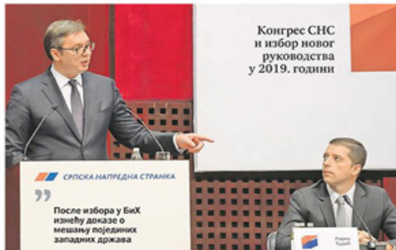
Конгрес СНС и избор новог руководства у 2019. години