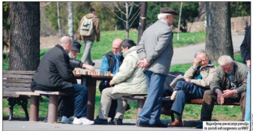
Najavljeno povećanje penzija će zavistiti od razgovora sa MMF