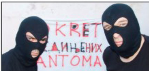
Reakcija Pokreta ujedinjenih fantoma povodom naslovne strane dnevnog lista Alo, na kojoj su predstavljeni kao potencijalni slobodnjaci „naprednjaci“