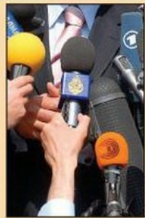
IFJ i EFJ osudili pritiske na medije u Srbiji