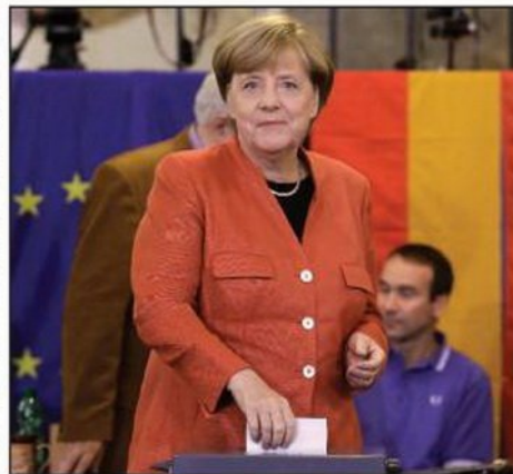
Angela Merkel prilikom glasanja

Izbori za vlast u Beogradu biće održani 3. decembra, tvrde mediji