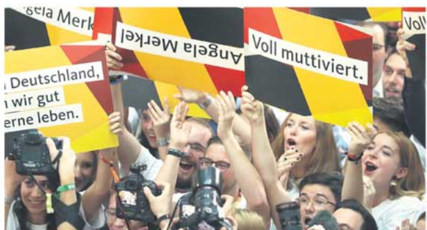
Радост присталица демохришћана неколико минута после 18 часова, када су проглашени први резултати