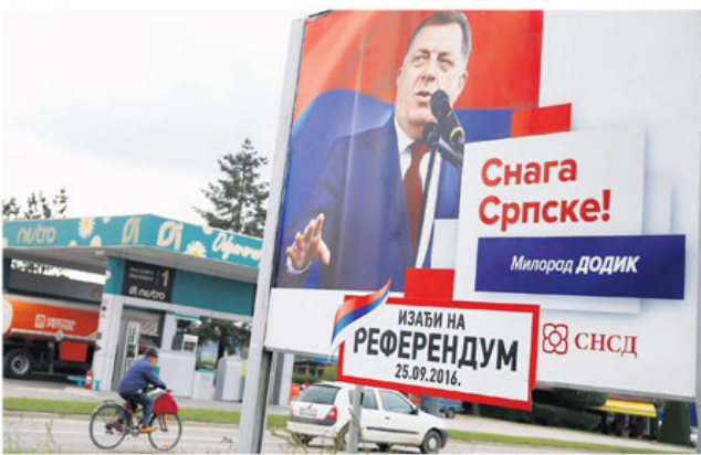
У Прњавору, пред данашњи референдум у Републици Српској

Британија се брзо плетло, грубо и неучко одвојила од Европе, а шта може да се очекује од других држава кад су у колеџи модерне демократије политичари (НСФМ) такву незрелу игру