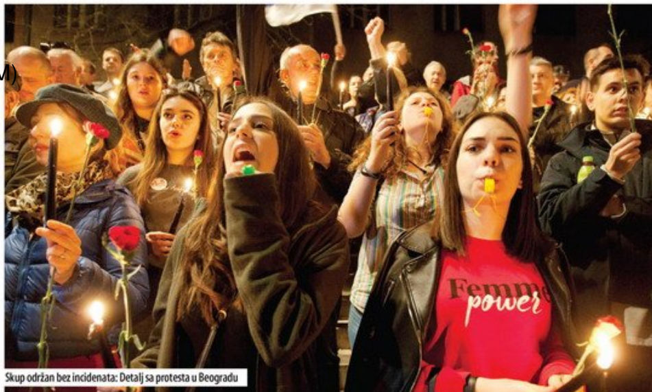
Skup održan bez incidenata: Detalj sa protesta u Beogradu