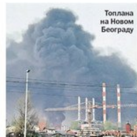
Топлана на Новом Београду

У многим другим местима, од Новог Сада до Грачанице, одата је пошта погинулим војницима, полицајцима и цивилима. Том приликом, венце су положили државни и локални функционери, породице жртава и удружења грађана. Поводом двадесетогодишњице ваздушних напада огласиле су се политичке странке, а стигла су и бројна реаговања из региона и иностранства. Опширније на странама 4 и 5