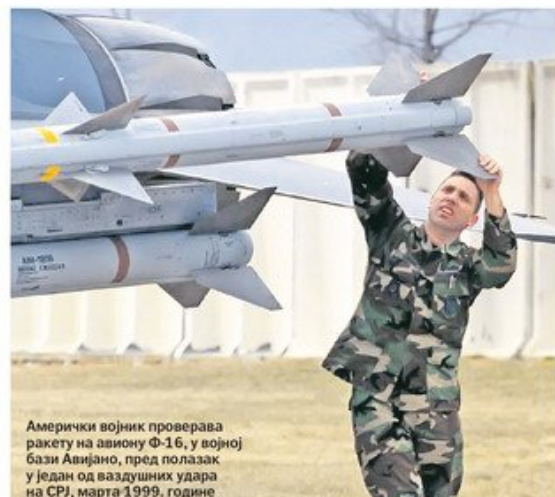
Амерички војник проверава ракету на авиону Ф-16, у војној бази Авијано, пред полазак у један од ваздушних удара на СРЈ, марта 1999. године