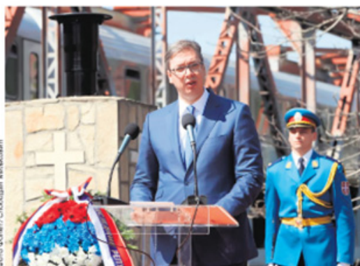
Александар Вучић на мосту у Грделици, где је погођен воз пун путника