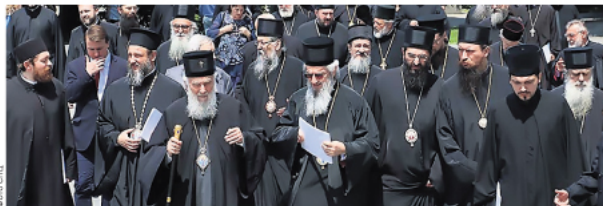
Патријарх и владике пред Храмом Светог Саве у Београду