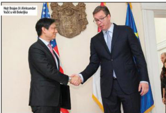
Hojt Brajan Ji i Aleksandar Vučić u vili Bokejka

Kako kaže naš sagovornici, Ji nije došao da „zavrće ruke“ i ispostavlja zahteve, jer ne treba zaboraviti da Zapad i dalje stoji na strani Vučića, koji zasad, prema njihovim procenama, nije ništa ozbiljnije zbog čega bi izgubio poverenje. Njega zanimaju planovi i njihovo ispunjavanje. A planovi trebaju, kako nama je rečeno, da podržavaju čvrste relacije i rad na evropskim integracijama, što zahteva nastavak normalizacije odnosa sa Kosovom i dijalog u Briselu, bez obzira na to ko će biti novi premijer te zemlje. Zatim je tu jedna crvena linija rasprave sa Rusijom, gde se postavlja pitanje potpunosti porazuma o Humanitarnom centru u Nišu i davanje diplomatskog statusa zaposlenima u njemu, kao i iznamljivanje u srpska pitanja BiH podržavajući predsednika