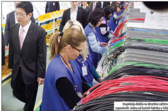
Inspekcija dobila na desetine zahteva zaposlenih: Jedna od Jurinih fabrika u Srbiji

U izveštaju inspekcije rada navodi se i da je u tri navrata inspekcija kaznila Juru zbog propusta sa 300.000 dinara, a Ministarstvo rada potvrdilo je Danasu da je tokom aprila 2013. fabrika Jura u Nišu donirala Inspektoratu za rad dva automobila, marke „kia ceed“ i to, kako se navodi u odgovoru, isključivo za „unapređenje i poboljšanje rada Inspektorata za rad, odnosno terenskog rada inspektora“. Lj. B. Strana 8