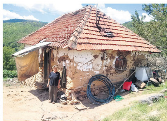
Бисера Ибрахимовић испред своје куће