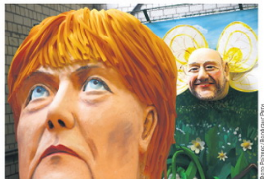
Припреме за карневал: Меркелова и Шулиц као инспирација уметника