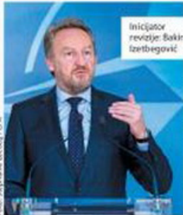
inicijator revizije: fakir Izetbegović

Sagovornici Danasa o budućnosti BiH nakon revizije tužbe za genocid