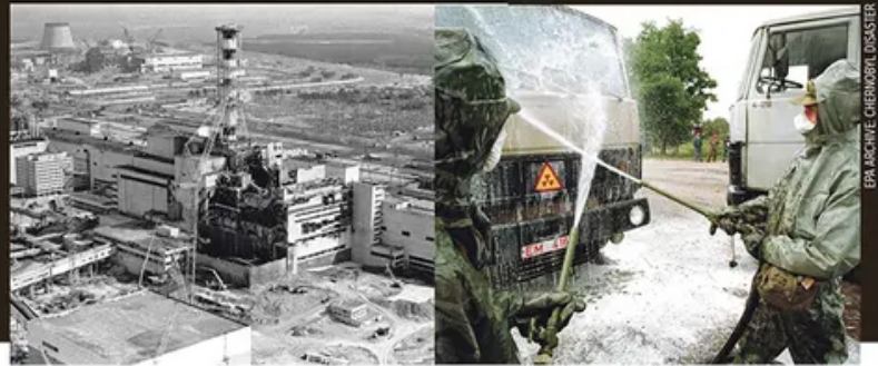
EPA ARCHIVE/CHERNOBYL DISASTER

Oblak je 29. aprila stigao do Slovenije, vetar ga je nad Srbiju doneo 1. maja, baš kada su građani boravili na urancima na otvorenom, ne znajući šta se dešava