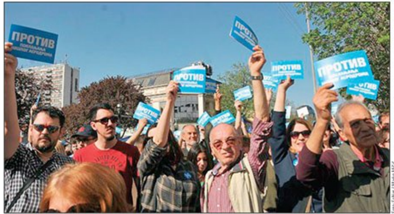
Opozicija u Nišu najavilo je da će u vreme posete Vučića obilaziti gradsku i opštinske uprave i javna preduzeća: Raniji protest Nišlija

Gradski odbor SNS-a prethodno je saopštio da Vučić dolazi kako bi prisu-