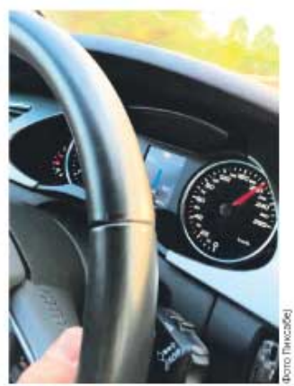
Реч је о пројекту МУП-а и „Путева Србије“, који мере брзину на основу времена проласка између две наплатне рампе

Разлика у времену и пређеној километражи на ауто-путу, од кућице до кућице, даје обрачун просечне брзине. План је био да сви који према овој рачуници воле брину од 120 километара на