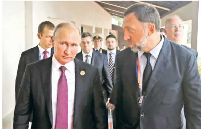
Владимир Путин и Олег Дерипаска

САД ће укинути санкције „Русалу“, водећем светском произвођачу алуминијума, уколико Олег Дерипаска прода свој удео од 48 одсто