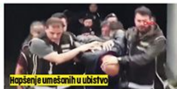
Hapšenje umešanih u ubistvo

Vukotić u Istanbulu živeo pod lažnim imenom Predrag Popović. U njegovom autu pronađena tri GPS uređaja. Njegovo kretanje nadzirale i dve žene