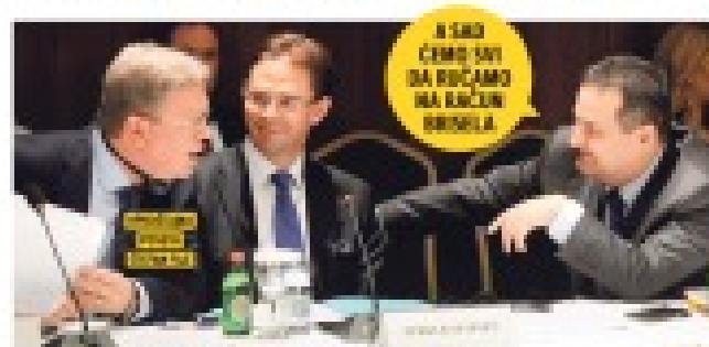
Šef diplomatije se sastao u četiri oka sa kolegama iz Prištine, izjavivši da igra Lukića ima nema. PREVOZIOCI ZA CRNOGORSKI put. EU ocenila sastanak ministara Srbije, Crne Gore, Kosova, BiH, Makedonije i Albanije isporukom Beograd došlo potražiti