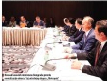
Ministri spolnih poslova i obrazovanja Kosova, Albanije, BiH, Makedonije, Crne Gore i Srbije razgovarali o zajedničkim problemima i saradnji u Prištini.

Ermer Hodžaji, ministar spolnih poslova i obrazovanja Kosova, rekao je u Prištini da Beograd i Priština treba da potpisu mirovni sporazum. Hodžaji je rekao da Beograd i Priština treba da potpisu mirovni sporazum.