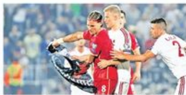
Тренутак када албански играчи општају заставу „велике Албаније“