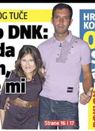
Strane 16 | 17

MOLIM VAS, DAJTE MI DA SE VRATIM U „ZADRUGU“