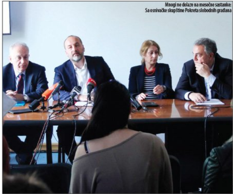
Mnogi ne dolaze na mesečne sastanke: Sa osnivačke skupštine Pokreta slobodnih građana