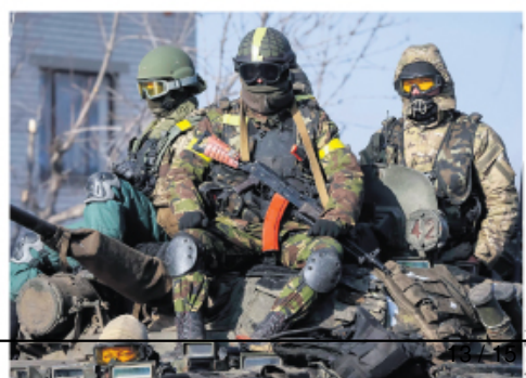
Уз редовну војску, постоје и бројни добровољачки одреди