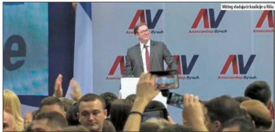
Miting vladajuće koalicije u Nišu