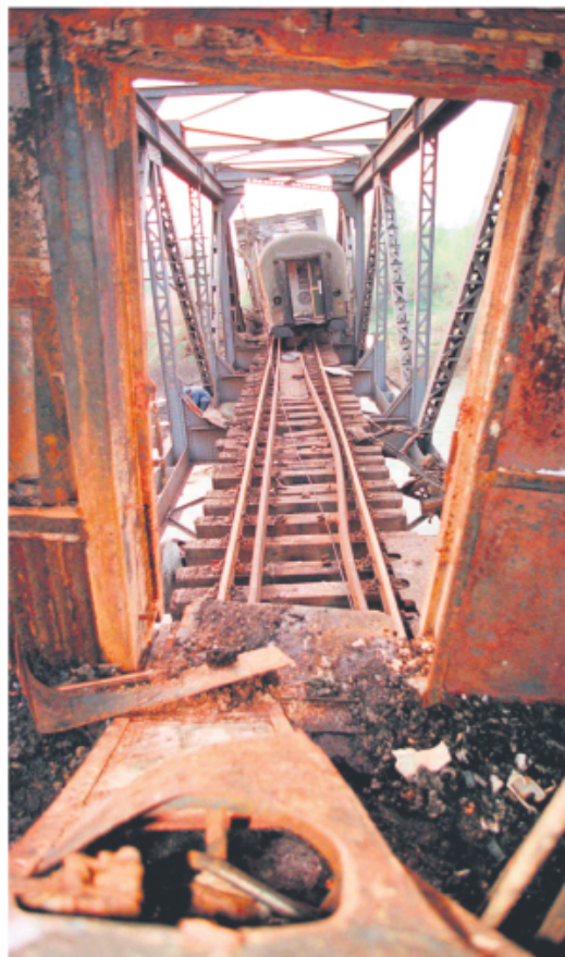
Путнички воз после бомбардовања на Грделичком мосту

У свом арсеналу политичких изума, моделу растурања вишенационалне СФРЈ, чланице Северноатлантске алијансе додале су и модел насилног цртања граница формирање нове државе од једне побуњене националне мањине