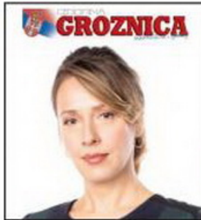
Poznata novinarka i supruga predsedničkog kandidata govori za Danas