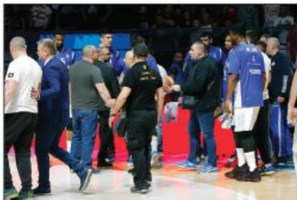
Skupština ABA lige danas u Banjaluci