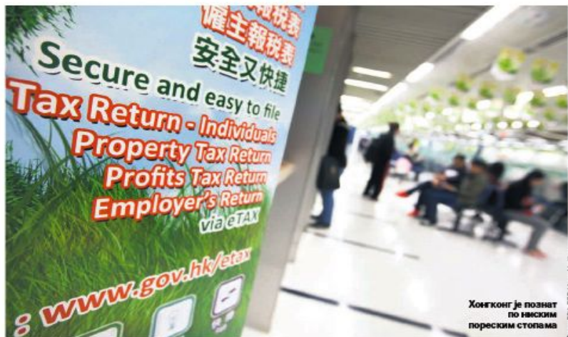
Хонгконг је познат по ниским пореским стоплама