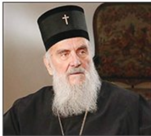
Patrijarh Irinej za Danas

●● SREDA, 24. januar 2018, broj 7422, godina XXI, cena 40 din, 30 den, 1 KM, 0,7 EUR (CG), 0,7 EUR (SLO), 5 kuna, 1,2 EUR (GR) www.danas.rs