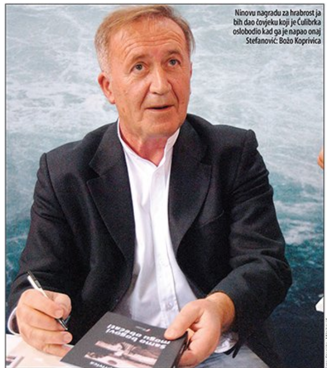
Ninovu nagradu za hrabrost ja bih dao čovjeku koji je Čulibrka oslobodio kad ga je napao onaj Stefanović. Božo Koprivica

Muhammed bin Zajed al Nahjan promenio planove na Kopaoniku