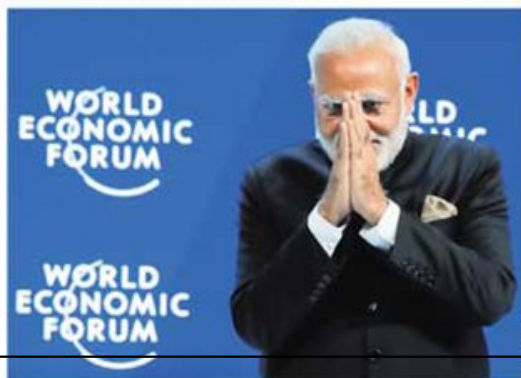
Премијер Индије Нарендра Моди јуче у Давосу

САД сматрају да без њих нема трајног мира на Косову