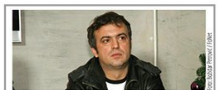
Sve učestalije pretjne javnim ličnostima putem društvenih mreža