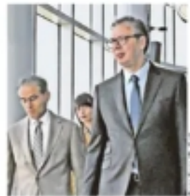
Мухамед Алабар и Александар Вучић