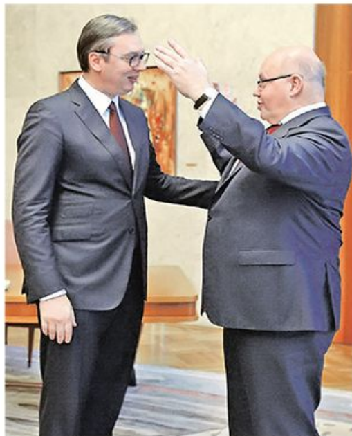
Председник Србије и немачки министар економије и енергетике