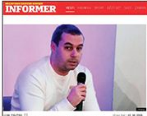
OVO MORATE DA PROČITATE! Ištvan Kaić: Narkoman i alkoholičari novinarstva!

Režimski mediji preneli članak u kome se novinari nazivaju narkomanima i alkoholičarima