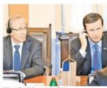
Амбасадор Мајкл Дагенхорн и сенатор Крис Марфи