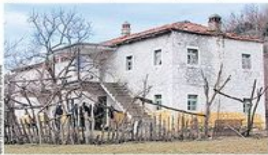
Одобрашена кућа у селу Рибце код града Брела на северу Албаније