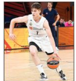
MVP juniorske Evrolige još bez odluke za koju će nacionalnu selekciju igrati

Zapaljeni automobil predsednika opštine Nova Varoš