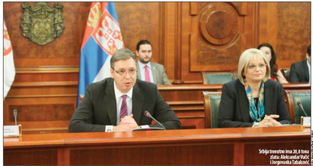
Srbija trenutno ima 20,8 tona zlata: Aleksandar Vučić i Jorgovanka Tabaković