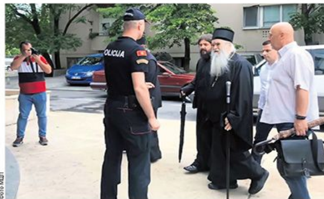
Од нашег сталног дописника Новица Ђурић

Подгорина – Црногорска полиција одбила је да обезбеди литије, али је зато била веома ефикасна у привођењу свештеника Митрополије црногорско-приморске Српске православне цркве. Само је у Беранма приврели шест свештеника, а полицијско испитивање од неколико сати