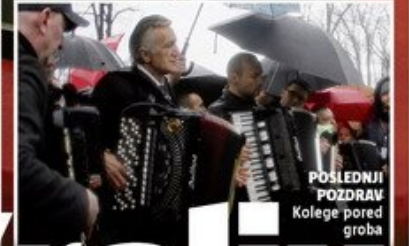
POSLEDNJI POZDRAV Kolege pored groba