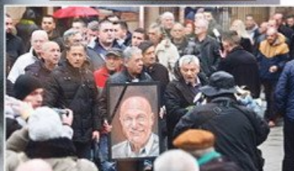
NAJMANJE 7.000 LJUDI OPROSTILO SE OD BALKANSKE ZVEZDE