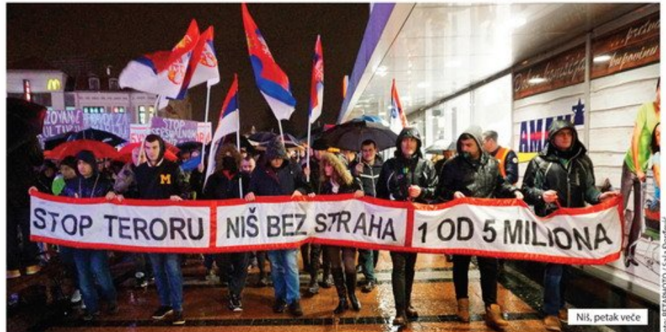
Niš, petak veče