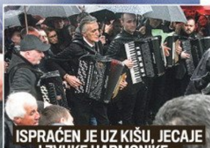
ISPRAČEN JE UZ KIŠU, JECAJE I ZVUKE HARMONIKE...