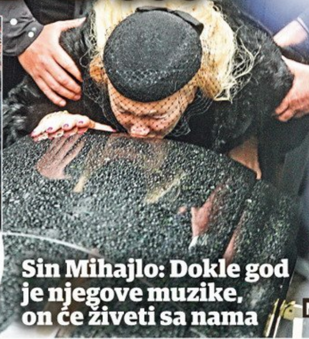
Sin Mihajlo: Dokle god je njegove muzike, on će živeti sa nama