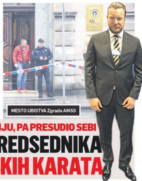
MESTO UBISTVA Zgrada AMSS