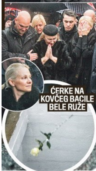
ČERKE NA KOVČEG BACILE BELE RUŽE