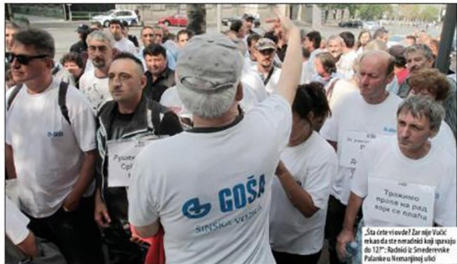
„Šta ćete vi ovde? Zar nije Vučić rekao da ste neradnici koji spavaju do 12?“, Radnici iz Smederevske Palanke u Nemanjinoj ulici

Beograd - Inič je bilo tačno pet meseci otkada se radnik Goše D. M. obećao u krugu fabrike jer nije imao od čega da živi. Inič je takođe bio dan kada su se zaposleni ovog preduzeća prvi put našli ispred Vlade Srbije tražeći da im se u punu osnovna radnička prava, koja D. M. u trenutku sazri nije imao - u plate zaslužile zarade (oko 600 000 po