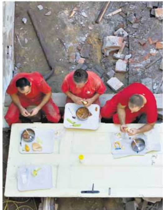
Ручак на грађевини: у Србији минималац прима више од 350.000 радника