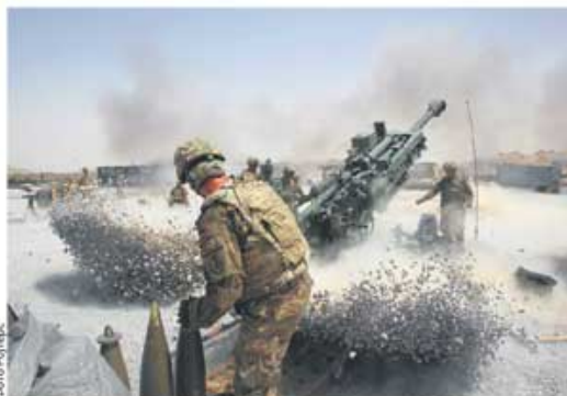
На фронт ће вероватно још 4.000 америчких војника, око 2.500 страдало

Одлазак Фејата Срђића, краља трубе стр. 7