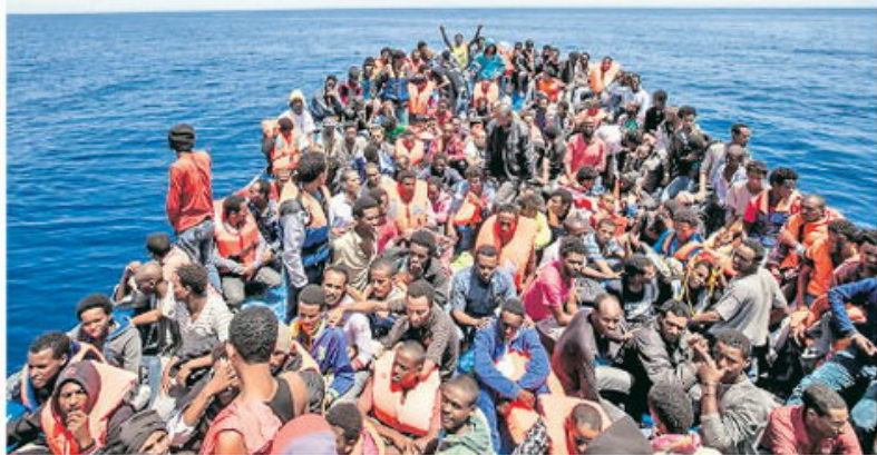
Брод с мигрантима близу либијске обале

Афричким државама са самита ЕУ поручено да задрже избеглице и приме натраг оне који су већ прешли Медитеран, иначе ће им бити ускраћени новчана помоћ и трговински аранжмани